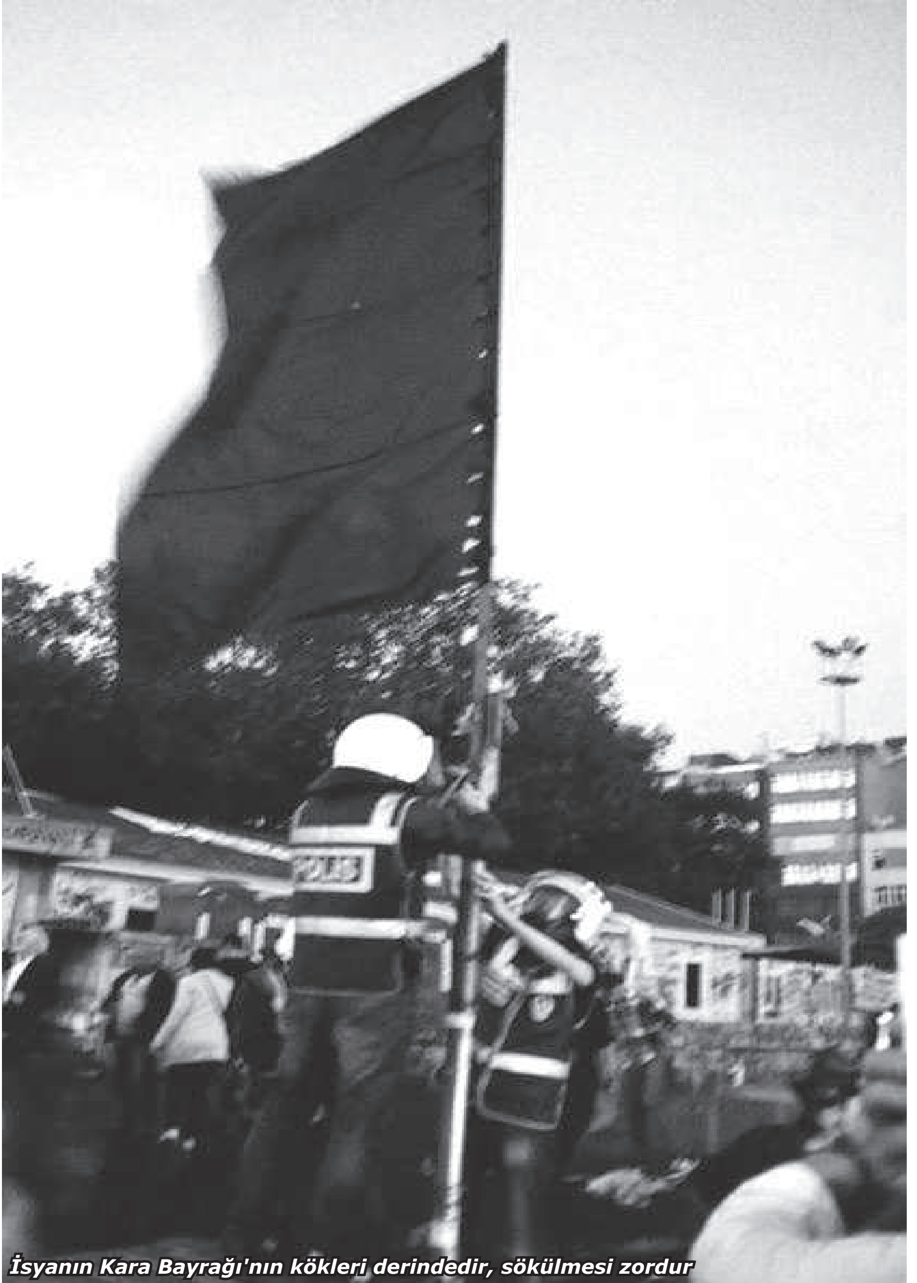
İsyanın Kara Bayrağı'nın kökleri derindedir, sökölmesi zordur