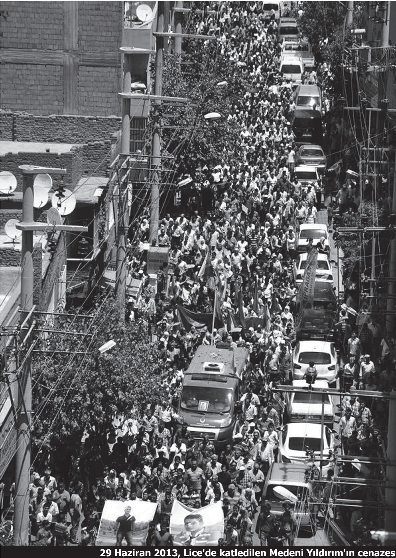
29 Haziran 2013, Lice'de katledilen Medeni Yıldırım'ın cenazesi

“ Hükümet adım at şiarıyla gerçekleştirilen mitinglerde barış sürecinin ilerlemesi ve hükümetin bu yönde ki adımlarının bir an önce gerçekleşmesi hedeflenmektedir. Bu mitinglerle Erdoğan'a sözünü tutması yönünde çağrılar yapılmaktadır. Ancak Lice de olduğu gibi görülüyor ki AKP barış için adım atmayı değil, kurşun sıkmayı seçmiştir. ”