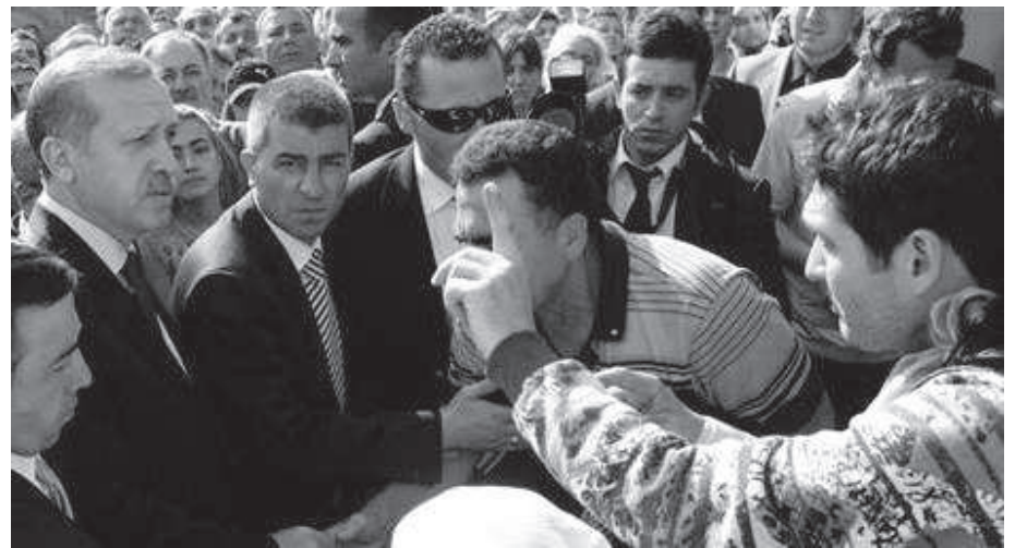
Katliam sonrası Tayyip Erdoğan 2010 yılında Zonguldak'ta grizu patlaması sonucu yaşamını yitiren 30 işçinin ardından söylediği sözleri tekrarladı. Yaptığı