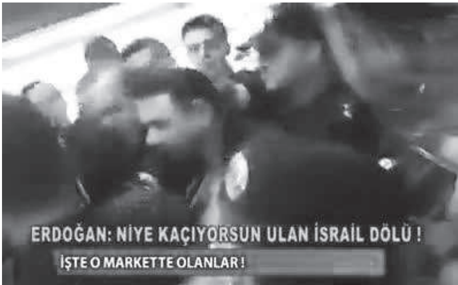
Başbakan Recep Tayyip Erdoğan, kendisini protesto ettiği gerekçeyle yaşamını yitiren bir madenci yakınına "Niye kaçıyorsun ulan İsrail dölü" diye bağırdı.