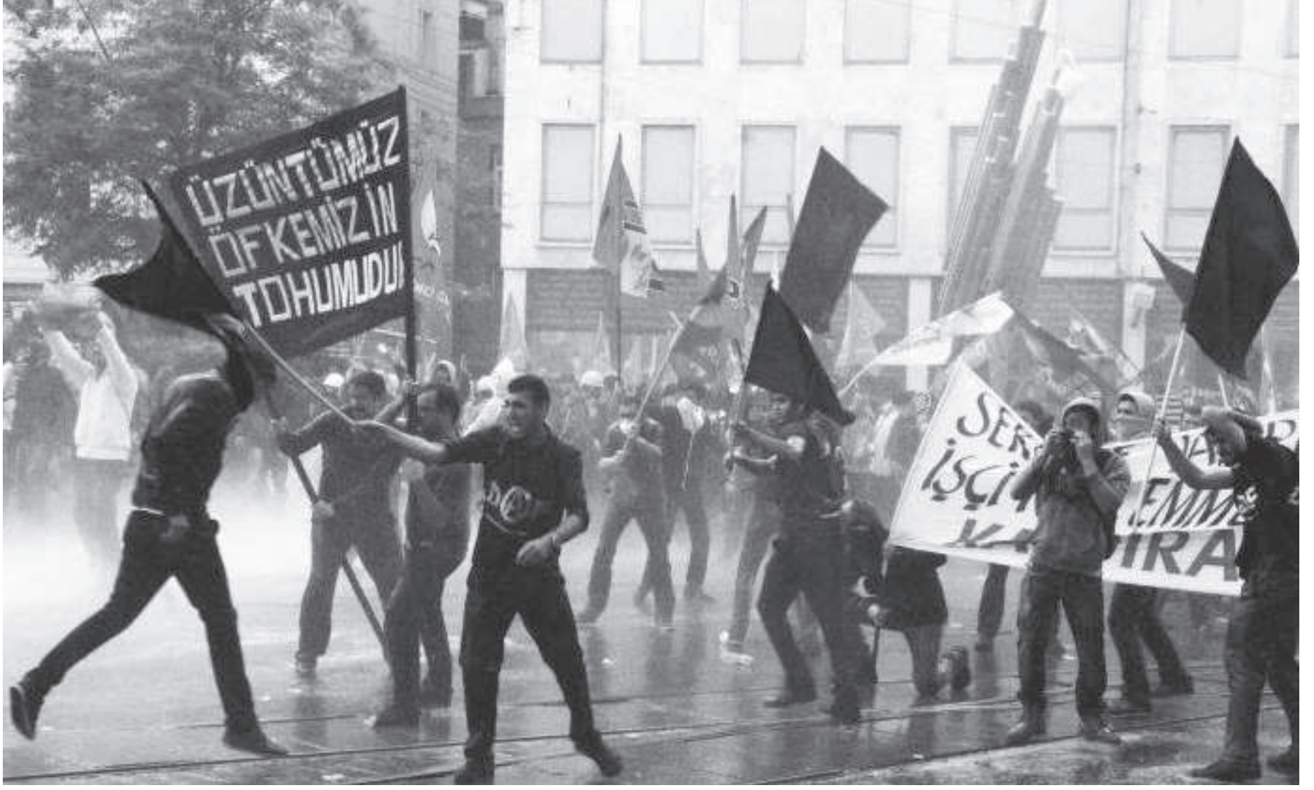
Tünel'den Galatasaray Lisesi'ne yürüyerek burada bir basın açıklaması gerçekleştiren topluluğa polis saldırdı. Halk, Soma için katillerin saldırısına karşı direndi.