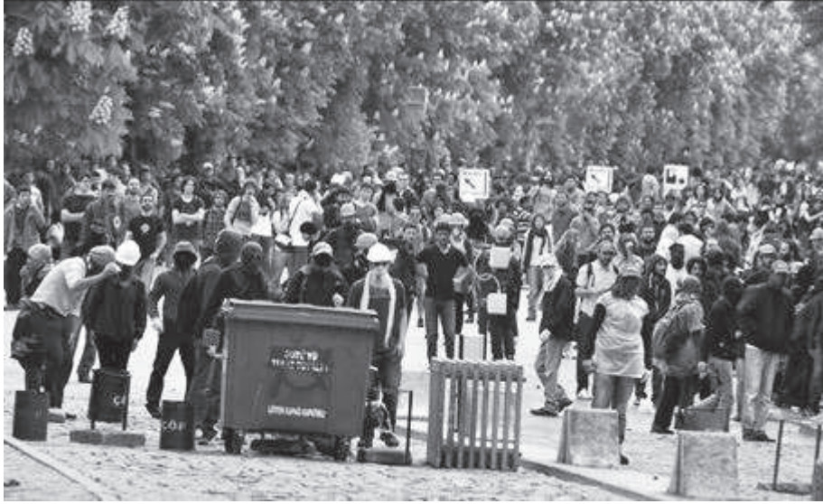
Soma'daki maden katliamının ardından ODTÜ'de işçilerin ölümlerini protesto etmek için Enerji Bakanlığı'na yürümek isteyen öğrencilere polis saldırdı.