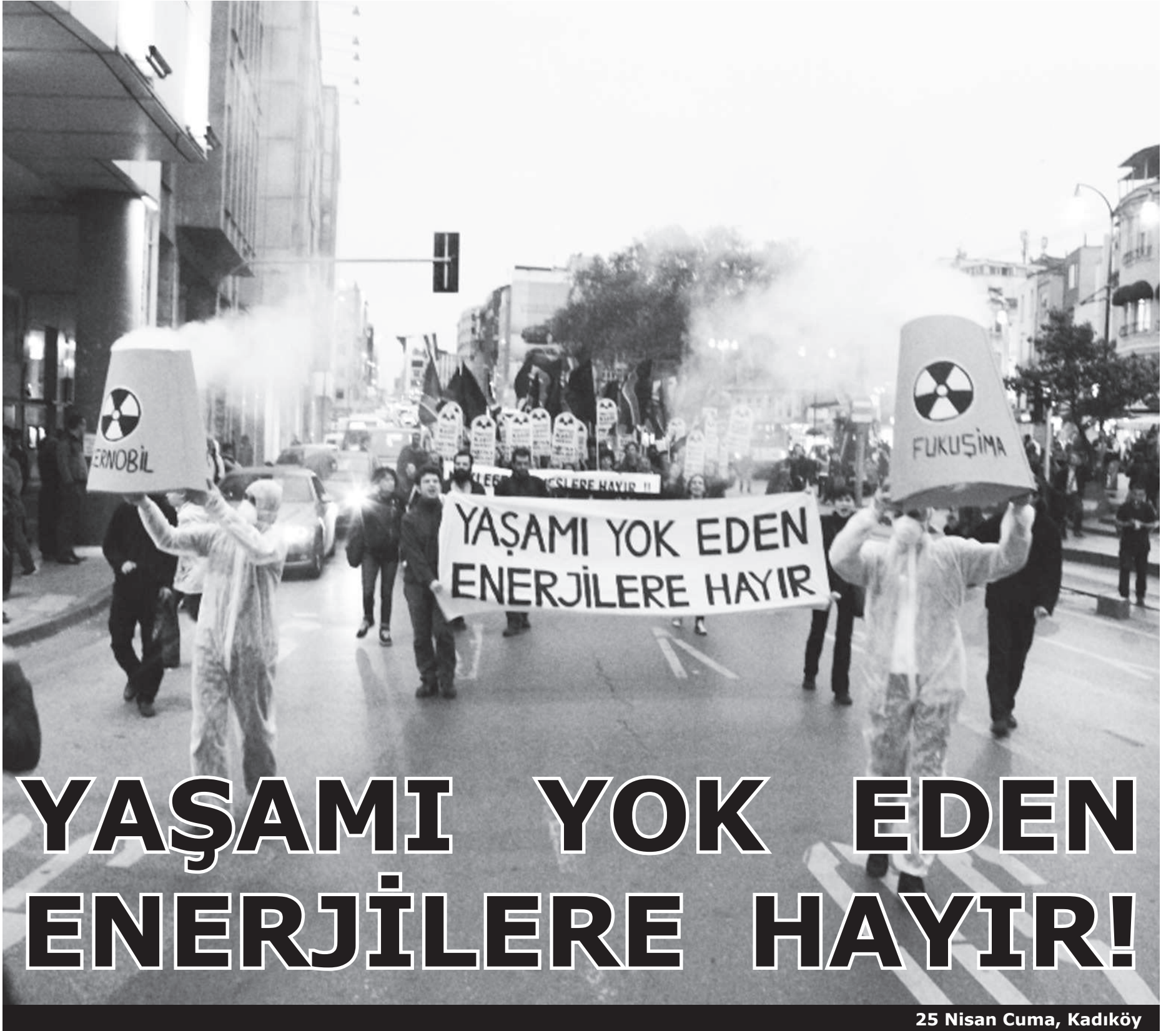
25 Nisan Cuma, Kadıköy

Çernobil katliamının 28. yıldönümünde 25 Nisan Cuma günü, yaşam savunucuları Kadıköy'de buluşarak bir basın açıklaması gerçekleştirdi. Aralarında Patika Ekoloji Kolektifi, Kedi Kolektif, Şavşat Derelerin Kardeşliği Platformu, Galyan Vadisi, Karaburun Yarımadası Ortak Yaşam Platformu, Munzur Koruma Kurulu, HDK Ekoloji, Pangea Ekoloji, Peri Suyu Koruma Platformu, Senoz Vadisi Koruma Platformu, Tarlataban, Yeşil Direniş Gazetesi, Ziraat Mühendisleri Odası, Tarım Orkam Sen, Sağlık Emekçileri Sendikası, Eğitim Sen, İnşaat İşçileri Sendikası, Anarşist Gençlik, AKA-DER, KAYY-DER, Kaldıraç ve TÖPG'nin olduğu pek çok ekoloji örgütü, dernek, sendika ve kurumun desteklediği yaşam savunucuları, Kadıköy Boğa Meydanı'nda toplanarak, Kadıköy İskele Karakolu önüne yürüdü.