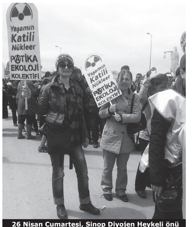
26 Nisan Cumartesi, Sinop Diyohen Heykeli önü

Basın açıklamasının ardından 26 Nisan Cumartesi günü Sinop'ta gerçekleştirilecek olan Sinop Nükleer Santral İstemiyor Mitingi'ne katılmak üzere yola çıkacak yaşam savunucuları uğurlandı.