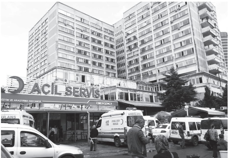
Acil servislerin önü polis araçlarından ya da taksilerden geçilmiyor, bir ambulansın hasta nakletmesi neredeyse imkansız