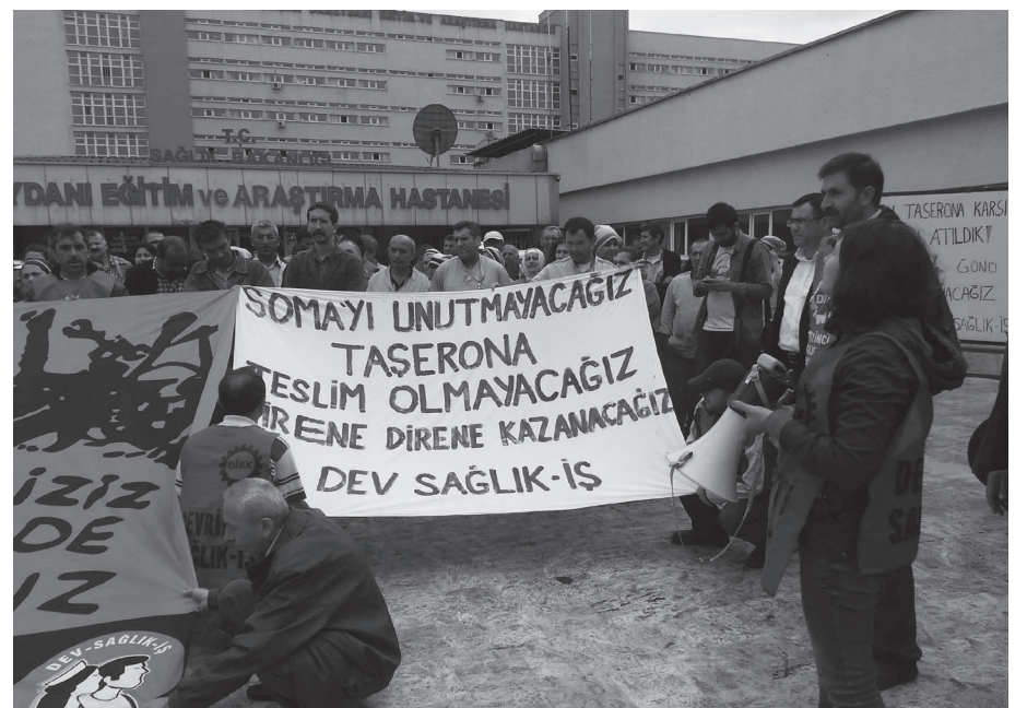
Okmeydanı Eğitim ve Araştırma Hastanesi'nde Soma'da katledilen maden işçileri için dayanışma eylemi yapan sağlık çalışanları hastane yönetimi tarafından işten çıkarıldı