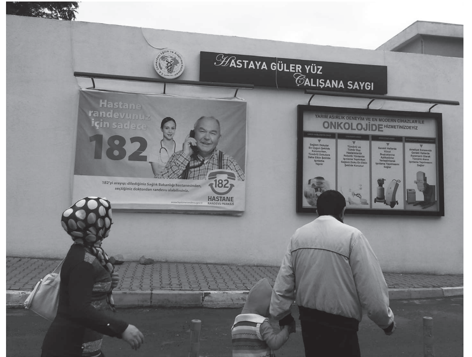
Okmeydanı Hastanesi'nin bir başka dış duvarında kocaman harflerle "hastaya güler yüz, çalışana saygı" yazılmış. Bu ifade çok manidar. Hâlihazırda olan bir şeyden söz etmedikleri kesin.

Okmeydanı Hastanesi'nin bir başka dış duvarında kocaman harflerle "Hastaya güler yüz, çalışana saygı" yazılmış. Bu ifade çok manidar. Hâlihazırda olan bir şeyden söz etmedikleri kesin. Hastaların yüzüne şöyle bir bakarsanız, olmayan bir şeyden söz edilerek bunu yazıldığını hemen anlarsınız. Çalışanların bir kısmı ise, geçtiğimiz ayki Soma katliamında ölen işçilere dayanışma eylemine katıldıkları için hastane yönetimi tarafından işten atılmış olduklarından, duvarda yazılı saygıyı göremedikleri gibi,