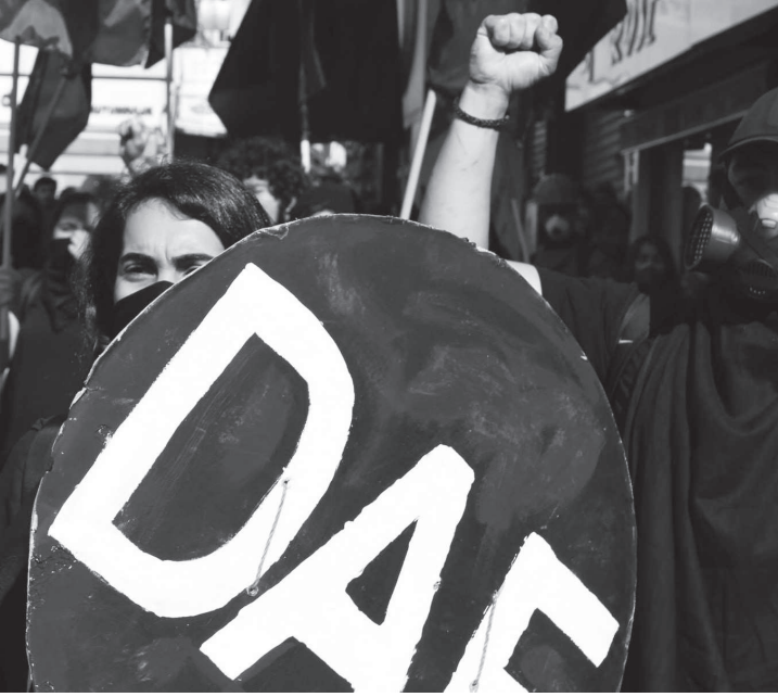
Yeni Akit gazetesinde yayınlanan "Olayların Arkasında DAF Var" başlıklı "haber" üzerine Devrimci Anarşist Faaliyet açıklama yaptı.

Yeni Akit gazetesinde 24 Mayıs 2014 tarihinde Salim kurşun ismi ile "Olayların Arkasında DAF Var" başlıklı bir "haber" yayınlanmıştır. Adeta polis diliyle Devrimci Anarşist Faaliyet'in meşru mücadelesi hedef gösterilerek yazılmış bu haber; Okmeydanı'nda geçtiğimiz hafta polisin saldırıları sonucu iki insanın katledilmesi ile başlayan eylemlerin, Devrimci Anarşist Faaliyet tarafından örgütlendiği iddiasını taşımaktadır. Yaşanan olayların polis tarafından başlatıldığını bildiğimiz gibi, Akit Gazetesi ve benzeri tetikçi medya kuruluşlarının geçtiğimiz seneden bu yana yaşamını yitiren tüm arkadaşlarımızı hiçleştirme çabası içerisinde habercilik yaptığını da biliyoruz. Adaletsizlikler karşısında meşru mücadelesini sürdüren devrimci kurumların hedef gösterildiği haberlerini bildiğimiz gibi.