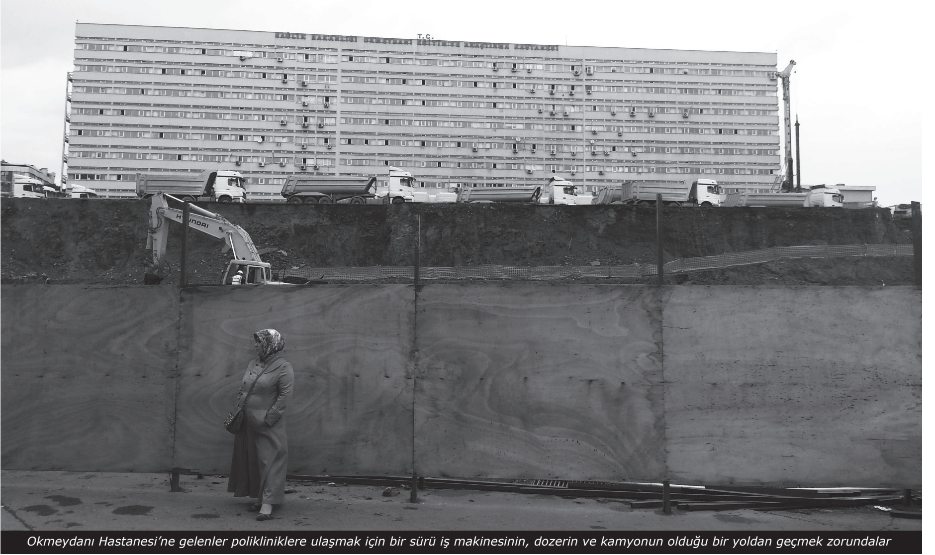
Okmeydanı Hastanesi'ne gelenler polikliniklere ulaşmak için bir sürü iş makinesinin, dozerin ve kamyonun olduğu bir yoldan geçmek zorundalar

ölülere bile saygı yok dercesine tepkililer. Ve ana kapı önünde bekleyişlerini sürdürüyor, işe geri alınma yolundaki taleplerini muayene ya da tedavi olmak için gelenlerin biraz şaşkın biraz da korkak bakışları eşliğinde haykırma devam ediyorlar. Hastane koridorlarına asılı sessiz olmayı işaret eden hemşire fotoğrafının tersine bu kez seslerini yükseltenler onlar, sağlıkçılar.