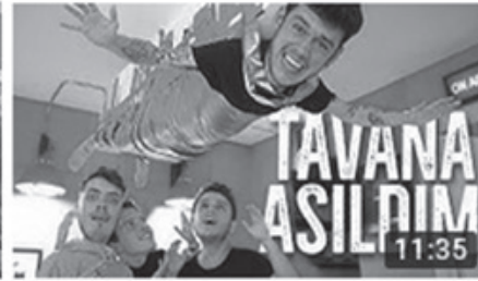
KENDİMİ TAVANA BANTLADIM! (EVDE) 11:35