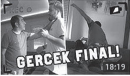
AMCAMA PSİKOLOJİK KIŞKIRTMA (GERÇEK FİNAL) 18:19