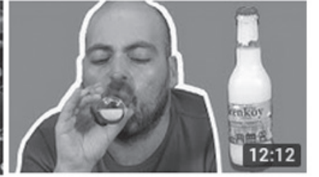
Hiç Tatmadığımız İçecekleri Tattık (Damla Sakızlı Su, 12:12