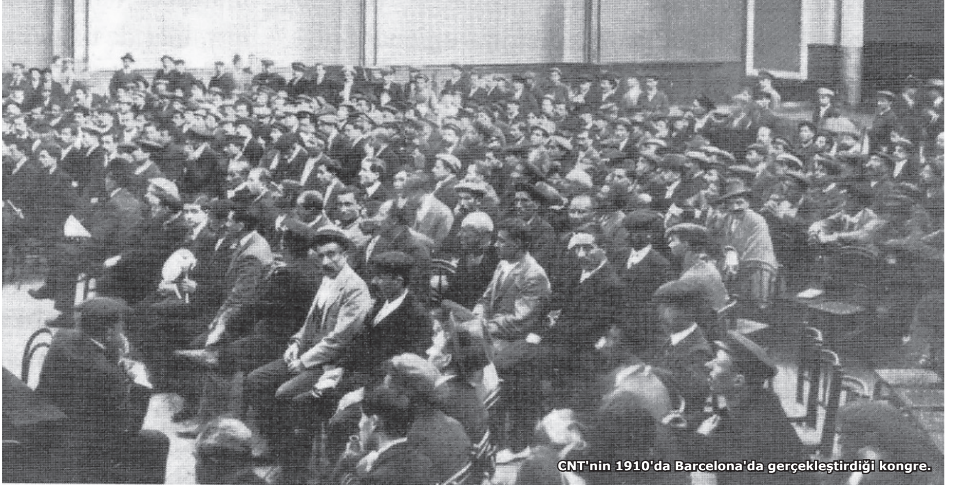
CNT'nin 1910'da Barcelona'da gerçekleştirdiği kongre.