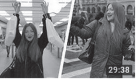
Milano'da 29 Saat Geçirdim! iPhone X Çekiliş Sonuçları 29:38