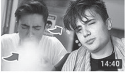
UN DOLU AĞIZ İLE TAKLİT YAP! #FurkanaKolayGele 14:40