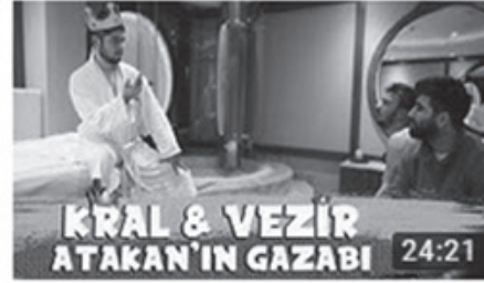
BİR GÜNLÜĞÜNE KÖLE OLMAK!! (KRAL&VEZİR) 24:21