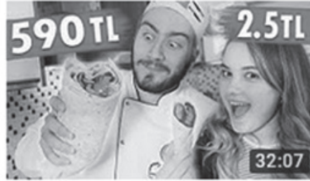
590 TL DÖNER VS 2.5 TL DÖNER (Et Dürüm) 32:07