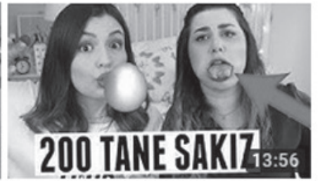
AYNI ANDA 200 TANE SAKIZ ÇİĞNEDİK! 13:56