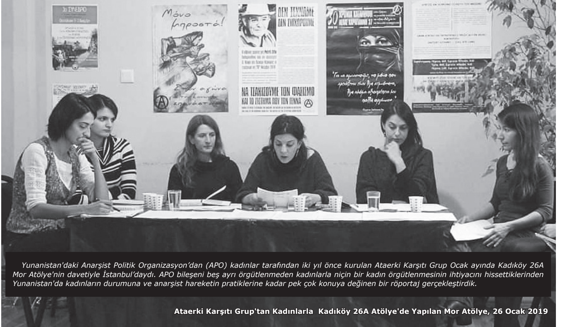
Yunanistan'daki Anarşist Politik Organizasyon'dan (APO) kadınlar tarafından iki yıl önce kurulan Ataerki Karşıtı Grup Ocak ayında Kadıköy 26A Mor Atölye'nin davetiyle İstanbul'daydı. APO bileşeni beş ayrı örgütlenmeden kadınlarla niçin bir kadın örgütlenmesinin ihtiyacını hissettiklerinden Yunanistan'da kadınların durumuna ve anarşist hareketin pratiklerine kadar pek çok konuya değinen bir röportaj gerçekleştirdik.

Ataerki Karşıtı Grup'tan Kadınlarla Kadıköy 26A Atölye'de Yapılan Mor Atölye, 26 Ocak 2019