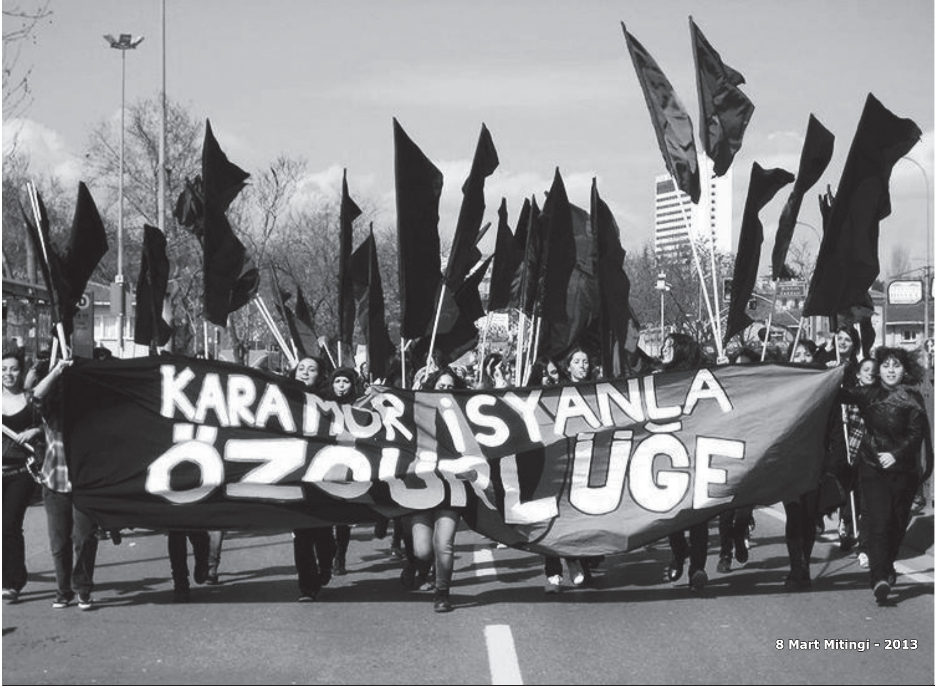
8 Mart Mitingi - 2013