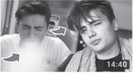
UN DOLU AĞIZ İLE TAKLİT YAP! #FurkanaKolayGele 14:40