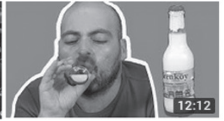
Hiç Tatmadığımız İçecekleri Tattık (Damla Sakızlı Su, 12:12