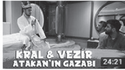
BİR GÜNLÜĞÜNE KÖLE OLMAK!! (KRAL&VEZİR) 24:21