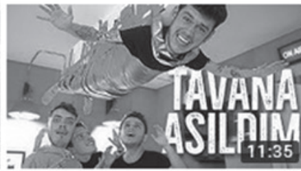
KENDİMİ TAVANA BANTLADIM! (EVDE) 11:35