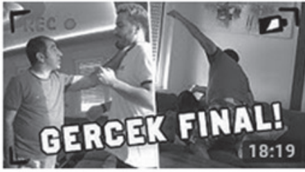
AMCAMA PSİKOLOJİK KIŞKIRTMA (GERÇEK FİNAL) 18:19