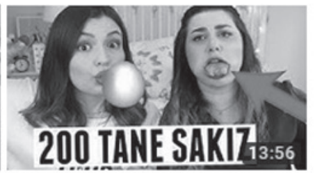
AYNI ANDA 200 TANE SAKIZ ÇİĞNEDİK! 13:56