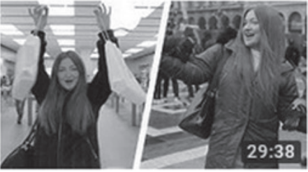
Milano'da 29 Saat Geçirdim! iPhone X Çekiliş Sonuçları 29:38