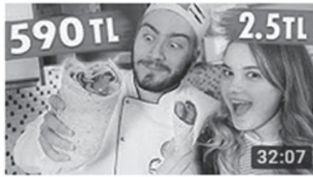
590 TL DÖNER VS 2.5 TL DÖNER (Et Dürüm) 32:07