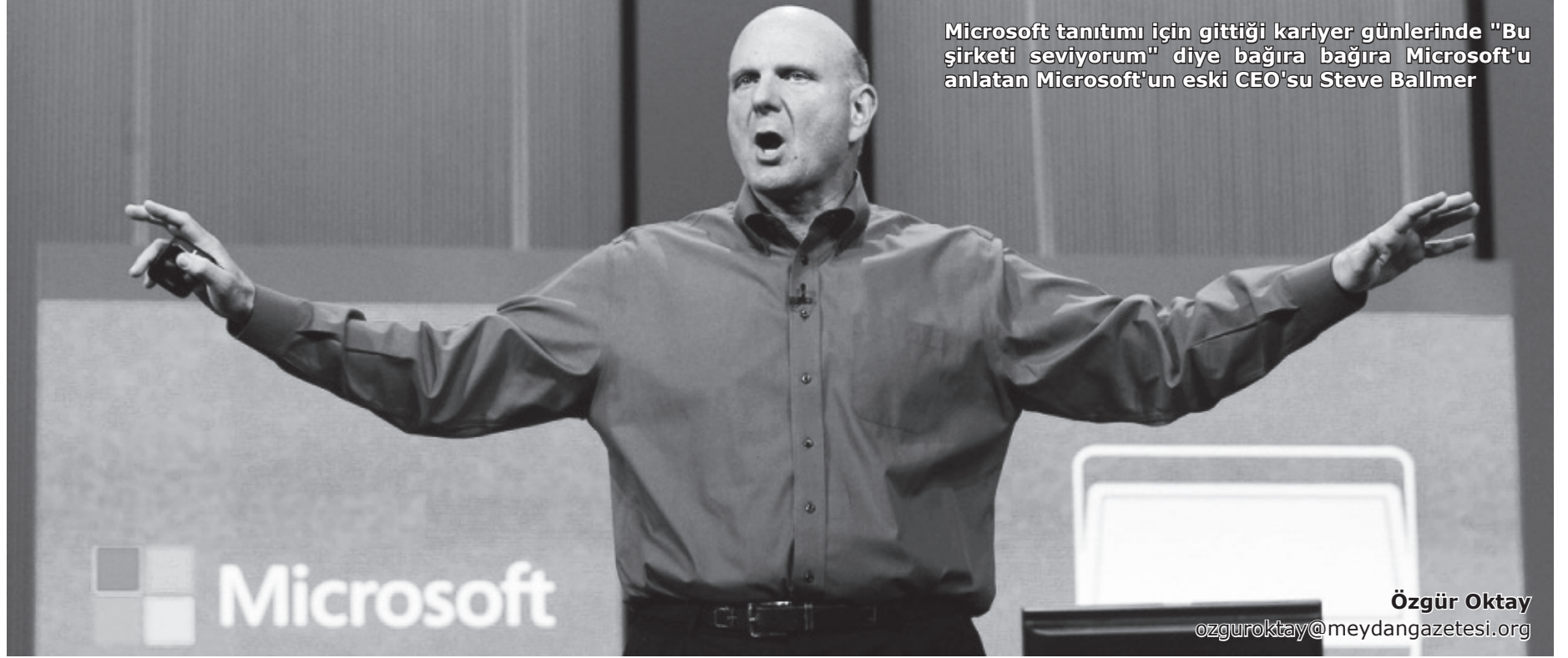
Microsoft tanıtımı için gittiği kariyer günlerinde "Bu şirketi seviyorum" diye bağırarak Microsoft'u anlatan Microsoft'un eski CEO'su Steve Ballmer