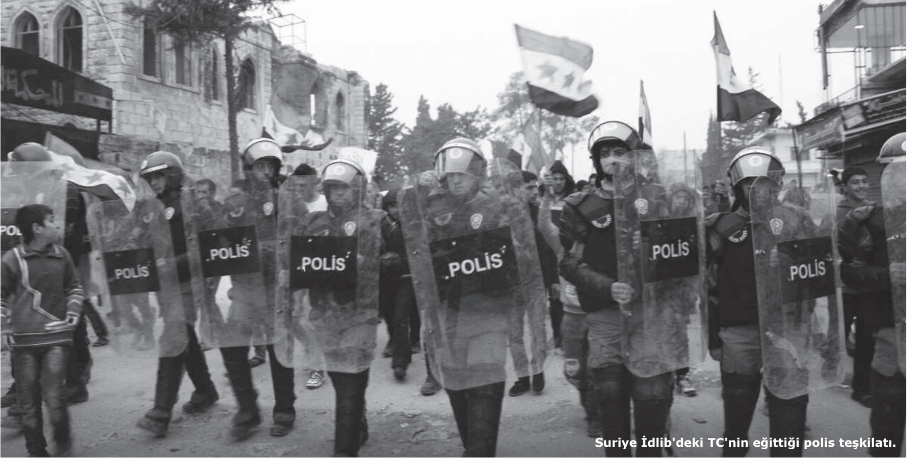
Suriye İdlib'deki TC'nin eğittiği polis teşkilatı.