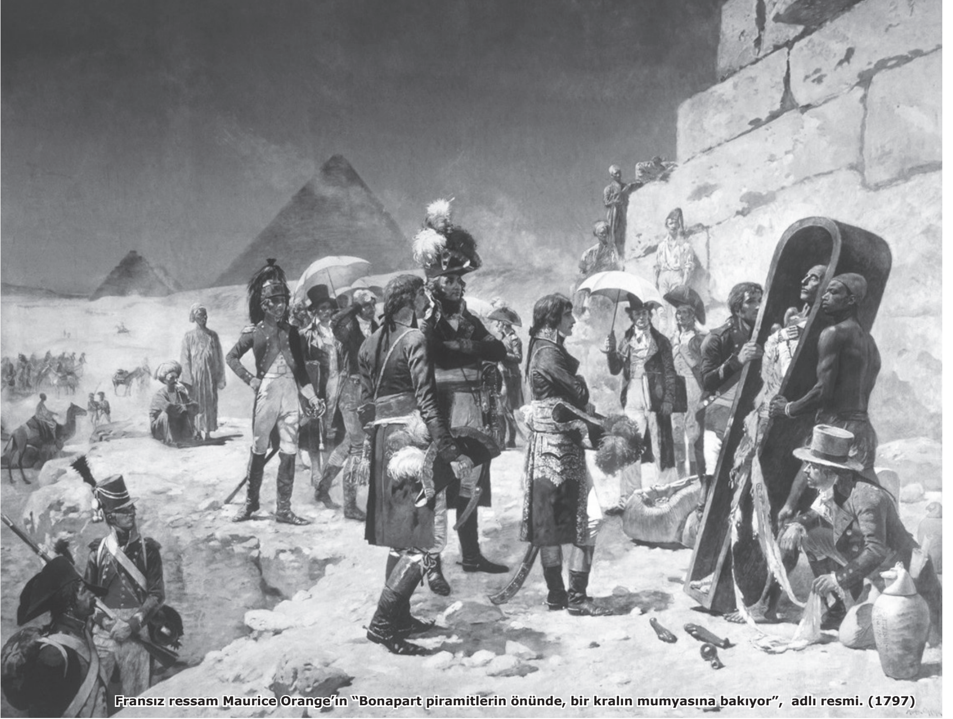
Fransız ressam Maurice Orange'ın "Bonapart piramitlerin önünde, bir kralın mumyasına bakıyor", adlı resmi. (1797)

bil yerleşiminin askeri üs haline getirilmesi söz konusuken hem de... Warka Baş'ının döndüğü yıllarda, MÖ 575'te inşa edilen ve 1900'lerin başlarında yürütülen kazı çalışmaları ile ortaya çıkmış Babil'in ünlü İhtar Kapısı'nın bulunduğu arkeolojik alanın ortasına inşa edilen askeri üs konusunda tarafsız kalarak işgali savunucu pozisyonuna düşen arkeologlar dahi mevcuttu.