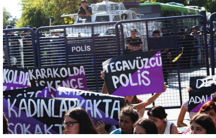
Anarşist Kadınlar Tacize Tecavüze Karşı Sokaktaydı s 8