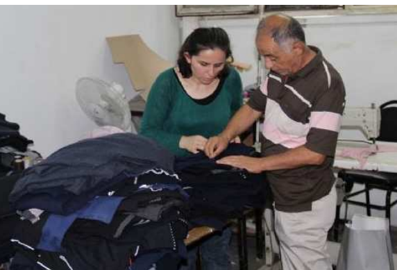
İstanbul'da Kazova İşçileri Fabrikayı İşgal Etti, Patronsuz Üretiyorlar