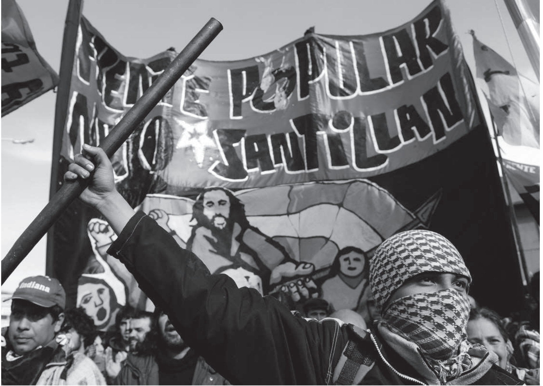
Piqueteros: Meydan Gazetesi'nin 5. Sayısında yer verdiğimiz Piqueteros, yani barikatçılar, ana yollara barikatlar kurarak başlattıkları eylemlerini mahallelerde ve fabrikalarda öz-yönetim deneyimlerine dönüştüren işçilerin hareketi.