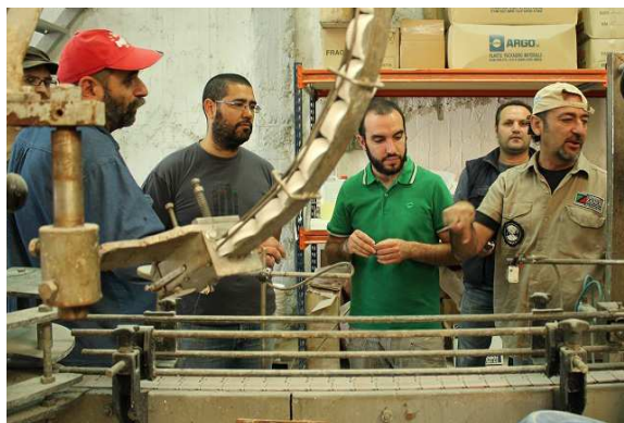
Selanik'te Vio. Me. İşçileri Fabrikayı İşgal Etti, Patronsuz Üretiyorlar