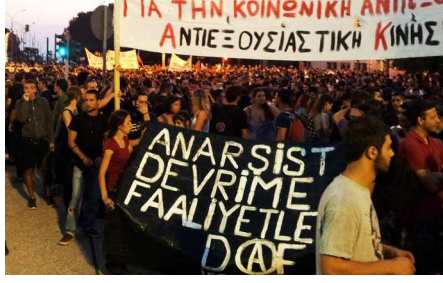
Selanik'te Doğrudan Demokrasi Festivali s 36