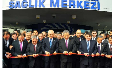
Hastane Öteye Rant Beriye s 14