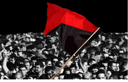
Anarşistlerin Ekonomi Tartışmaları (5) Patronsuz İşçiler, İşçilerin Öz-yönetimi s 28