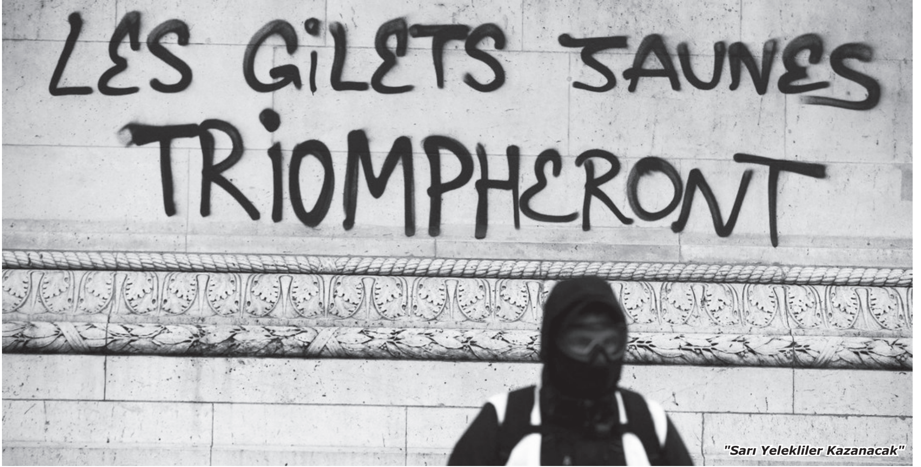
"Sarı Yelekliler Kazanacak"

tıkları doğrudur. Ancak bu toplaşmalarda bizim de katkıda bulunduğumuz güçlü bir karşı koyuşla karşılaştılar ve gösterilerde protestocular tarafından saldırıya uğramadan ortalığa çıkamadılar (biz 1 Aralık 2018'de bir grup neo-naziye müdahalede bulduk, o zamandan beri hâlâ saklanıyorlar). Sarı yeleklilerin hareketi sırasında bir İslamcı saldırı meydana geldiğine ve bunun hareket tarafından yabancı düşmanlığına veya ırkçılığa sebebiyet vermediğine dikkat edilmelidir.