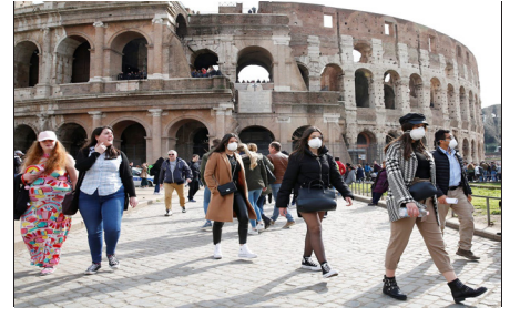
Korona ve İtalya: İtalya Anarşist Federasyonu Değerlendirmesi