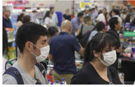
Korona ve İşçiler: Genç İşçilerin Koronayla Mücadelesi