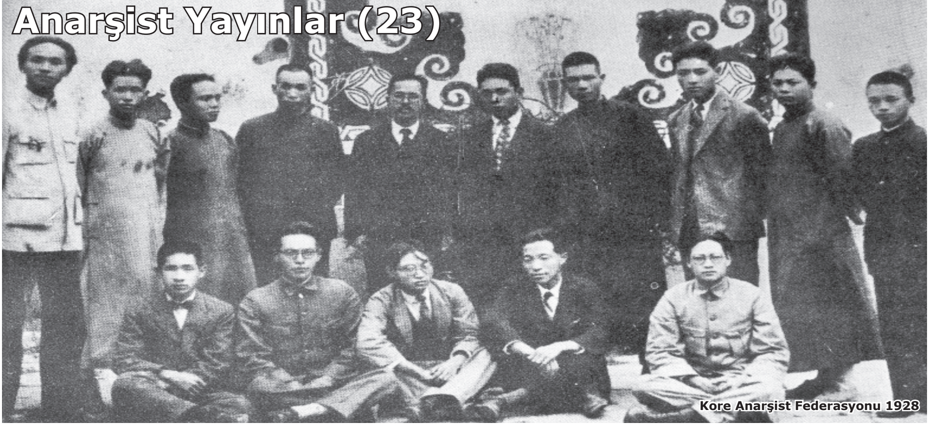
Kore Anarşist Federasyonu 1928