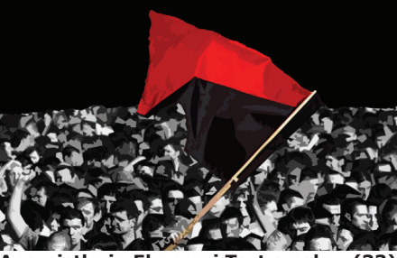
Anarşistlerin Ekonomi Tartışmaları (33) Ekonomiyi Yenmek