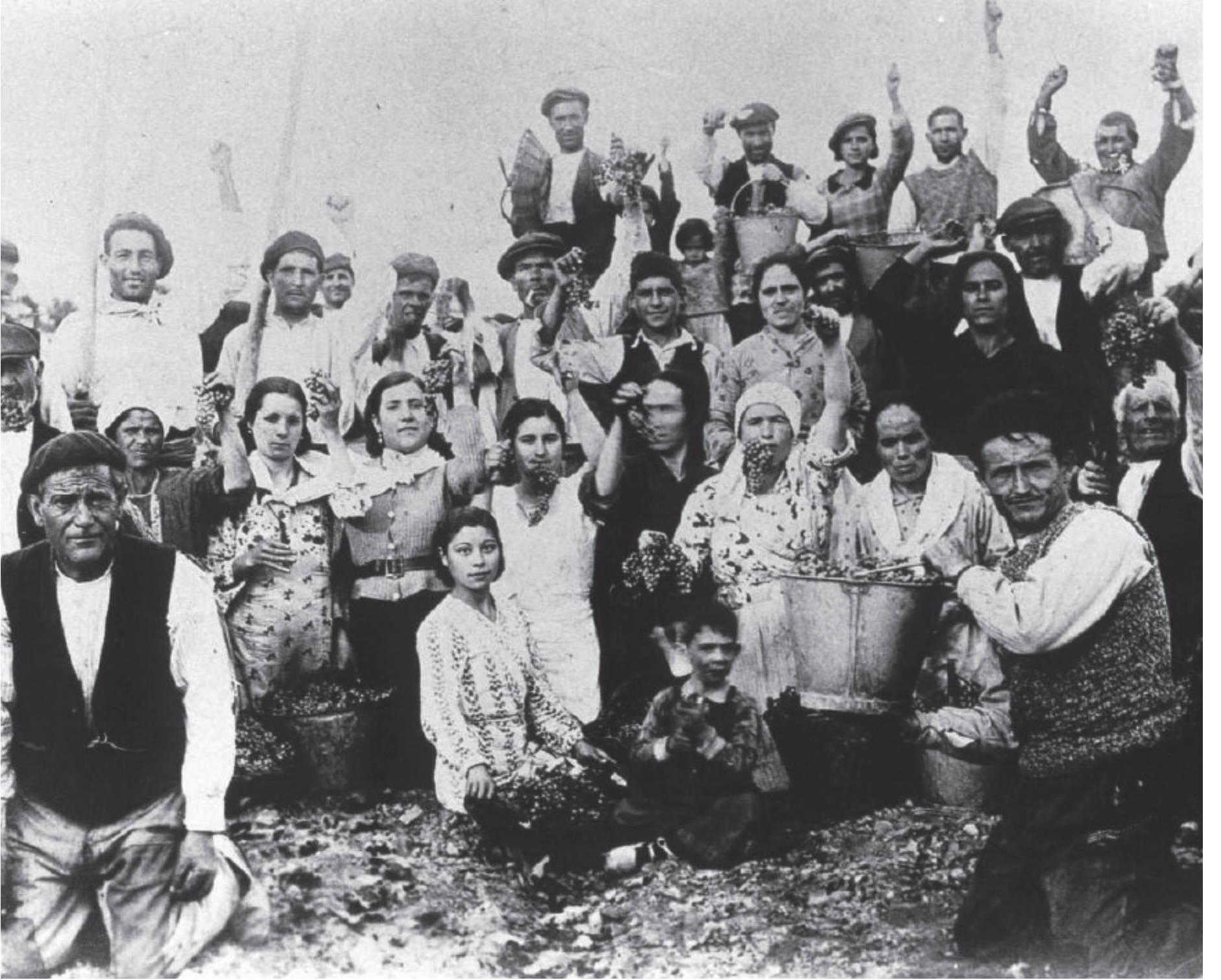
Mas de las Matas topluluğunun hasat çalışma grubu, İspanya-1936